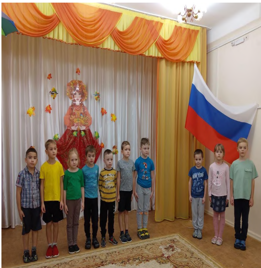
Еженедельное исполнение Гимна РФ. Традиция воспитанников старшего дошкольного возраста МБДОУ № 35

Средством нравственно-патриотического воспитания является атмосфера, в которой живет ребенок. Окружающая ребенка обстановка становится средством воспитания чувств, представлений, поведения. Она активизирует весь механизм нравственно-патриотического воспитания и влияет на формирования нравственных и патриотических качеств. Выбор средств воспитания зависит от ведущей задачи, от возраста воспитанников, от уровня их общего и интеллектуального развития. Средство становится эффективным в сочетании с адекватными методами и приемами воспитания.