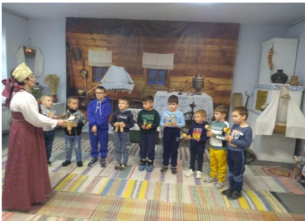
Экскурсия выходного дня с родителями.

Особое место в группе средств отводится общению. Оно как средство нравственно-патриотического воспитания выполняет задачи корректировки представлений о нравственности и патриотизме, на основе пробуждения чувств и формирования отношений.