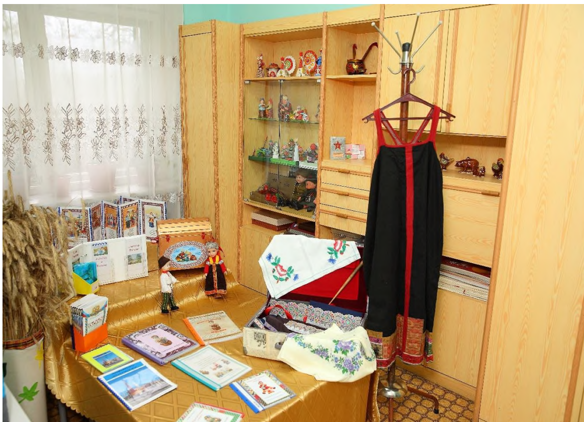
Создание музейной экспозиции в МБДОУ №35